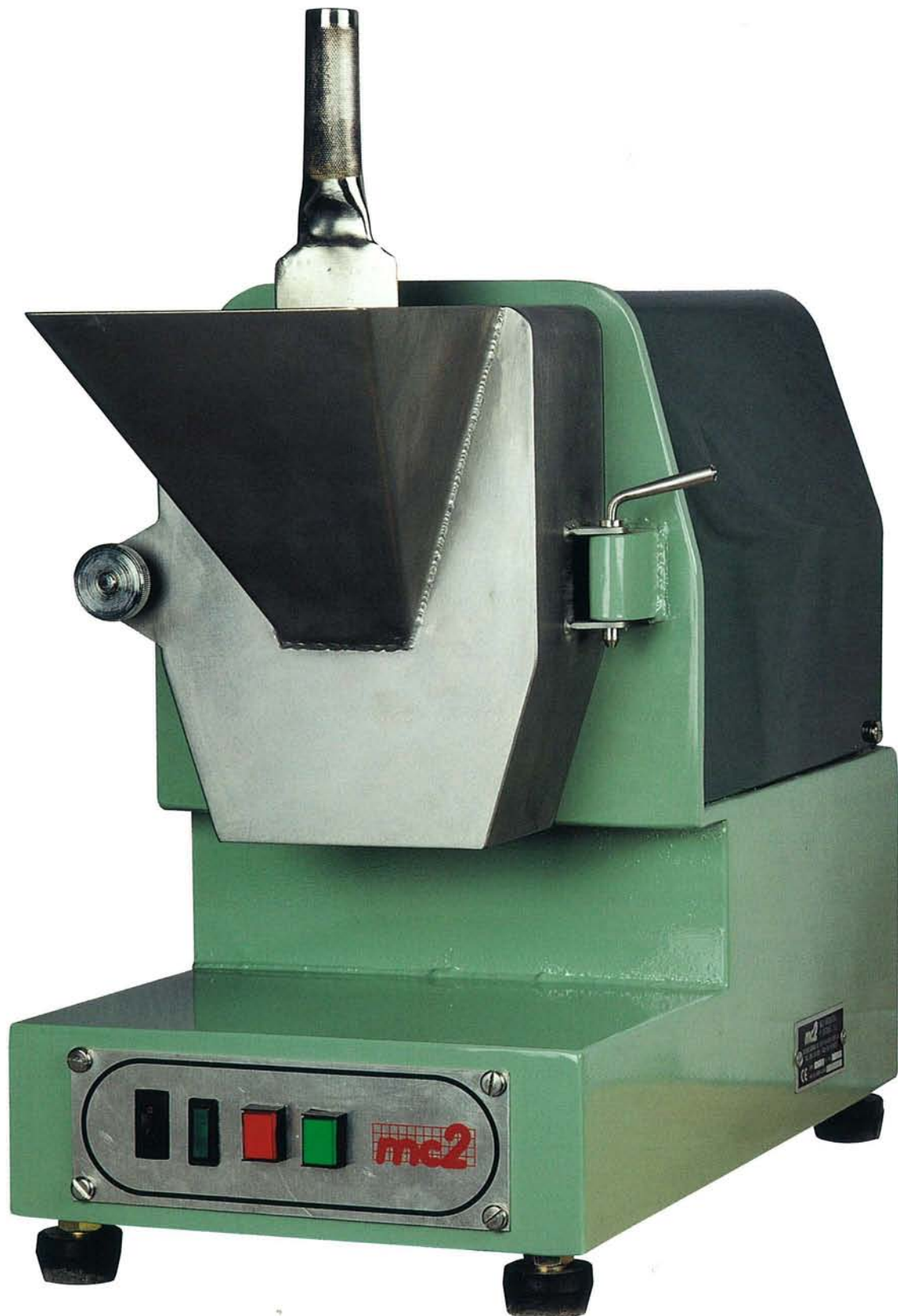
MOLINO DE MARTILLOS MM-100